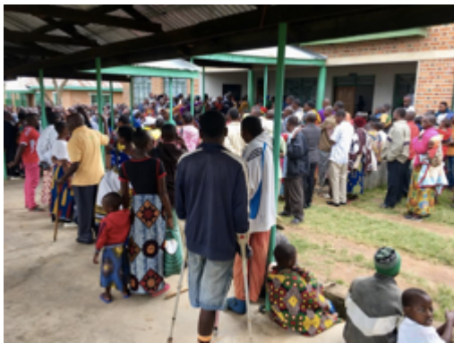
Wartende Patienten beim OP-Camp des DKVB

Da der aktuelle „Camp-Charakter“ wenig Perspektive hat, will das DKVB Maßnahmen zur Schaffung einer nachhaltig gesicherten augenärztlichen Versorgung der Region treffen. Hierzu gehört in erster Linie das Ausbilden örtlich ansässiger Menschen zu Fachpersonal für einen dauerhaft eingerichteten Klinikbetrieb. Des Weiteren werden mit der Klinikleitung sowie der für die Region zuständigen Regierungsabteilung Pläne für den Bau einer Augenklinik auf dem Areal des Dr. Atiman Memorial Hospital geführt.